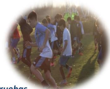
Pruebas Masivas abiertas