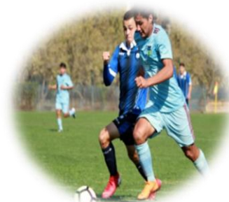
Fútbol Joven O'Higgins