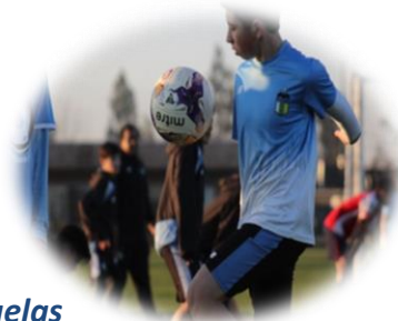
Escuelas de Fútbol O'Higgins y Filiales